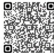
申し込み2次元バーコード

公益社団法人 認知症の人と家族の会 茨城県支部 住所 〒300-1292 茨城県牛久市中央3-15-1(牛久市保健センター隣) 電話 / FAX 029-828-8089 メールアドレス alz2010ibaraki@yahoo.co.jp ホームページ http://alzibaraki.starfree.jp